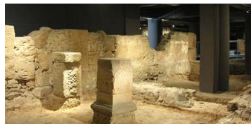
Subsòl de la Plaça del Rei. La ciutat romana