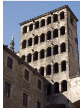
Mirador del rei Martí. Finalitzat el 1555