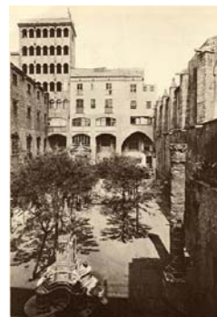
La Plaça del Rei. Fotografia del 1928