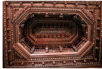
Sostre enteixinat del Palau del Lloctinent