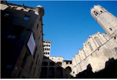
Vista general de la Plaça del Rei