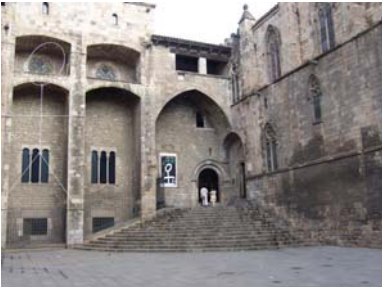
La Plaça del Rei i l'entrada al Saló del Tinell