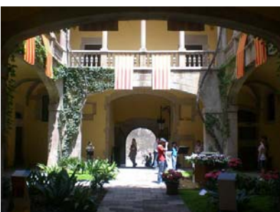
Interior del Palau del Lloctinent.