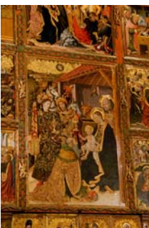
Retaule de Pere IV, el conestable de Portugal. Obra de Jaume Huguet.