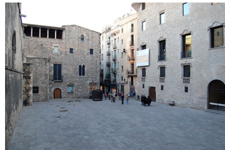
La Casa Padellàs.