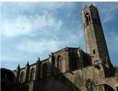
Capella de Santa Àgata